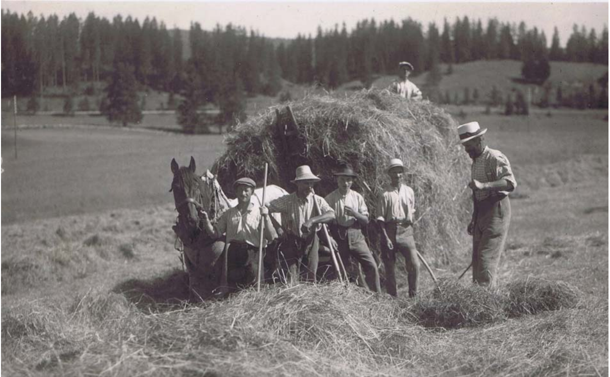
Une belle équipe à la Recorbaz.