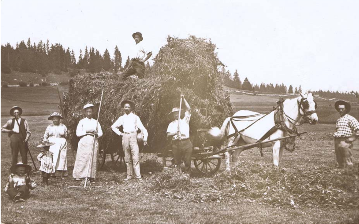
Est-ce au Lieu ?