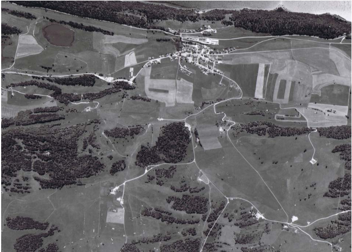
Le territoire agricole du Lieu vu du ciel vers 1970.