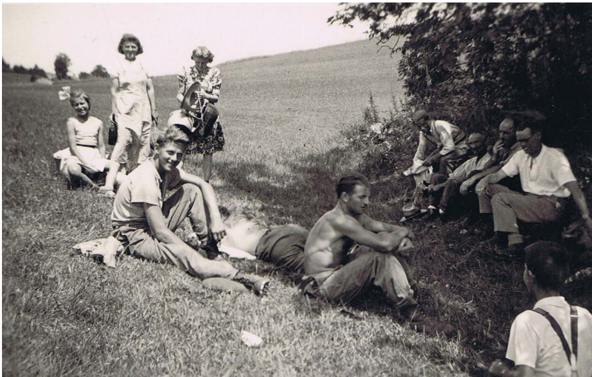
Au Lieu, au temps des foins, le repos des travailleurs, professionnels ou amateurs !