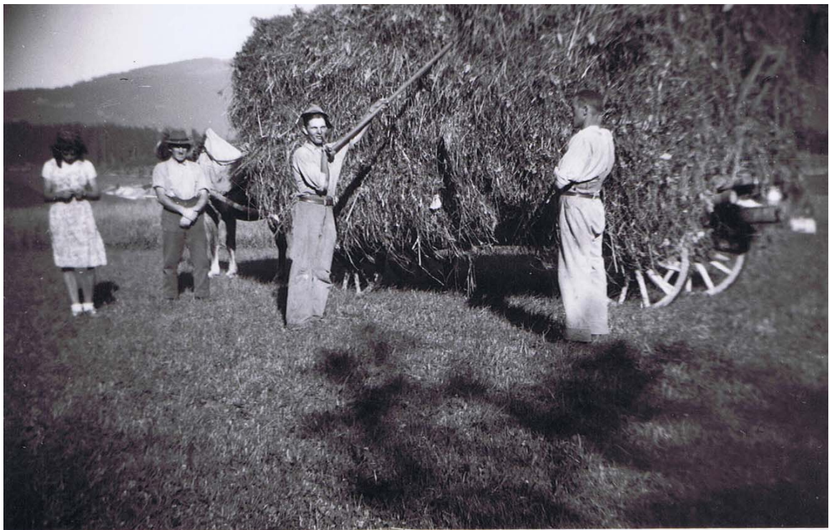
Sur le le Saugy.