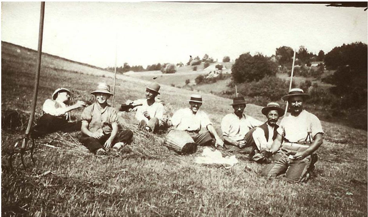
Au pied du Saugy, on s'en donne une belle tranche – de bon temps ! – avant que de recommencer le boulot.