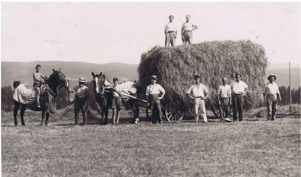
Probablement sur le Saugy.